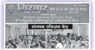
संगणक प्रशिक्षण केंद्र